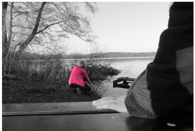
Fotografía escénica: Trabajo de un alumno, c.12

Los alumnos aprenden a analizar con conceptos estéticos del pasado y de la actualidad y a contrastarlos formulándose preguntas y planteándose cuestiones que están asociadas a nuestro mundo actual, tan marcado por los medios. Tanto los diseños de imágenes tradicionales como modernos son puestos a prueba y se discuten, como, por ejemplo, las posibilidades creativas a base de fotografía y vídeo.