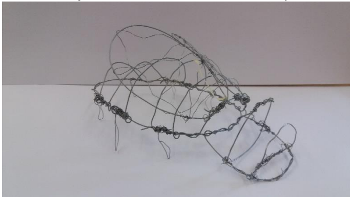
Escarabajo, trabajo en alambre, clase 6

En las clases 5, 6 y 7 la asignatura se imparte en dos horas semanales. En estos niveles damos a conocer las diferentes técnicas y posibilidades de las formas, tales como dibujar con diversos materiales, pintar con diferentes colores, también modelar con arcilla, alambre y cartón, realizar trabajos manuales, el trabajo plástico como el modelado, y enseñar sencillas técnicas de impresión.