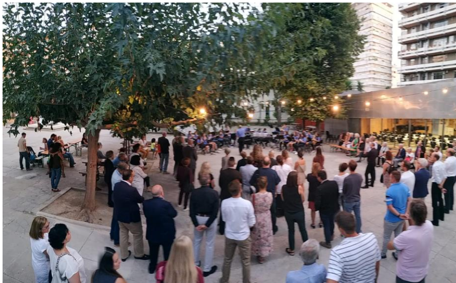
Das Schulorchester der DSV auf dem Schulhof.