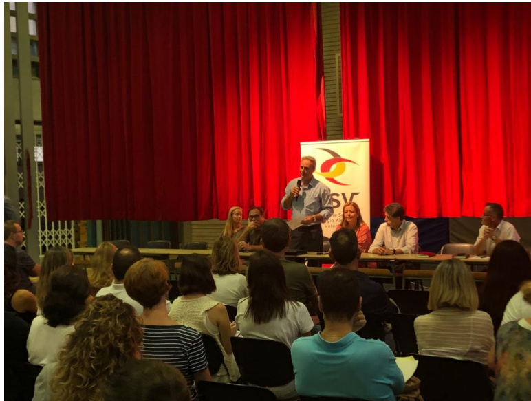
Die Mitglieder des Vorstands stellen sich den neuen Eltern der Schule vor.