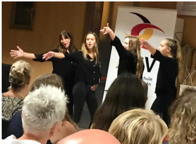
Das Vokalensemble der DSV.

Der Abend verlief in einem sehr entspannten Ambiente. Nach den Ansprachen und Vorstellung des neuen Lehrpersonals konnten sich alle bei einem Glas Wein oder Bier auf dem Schulhof austauschen.