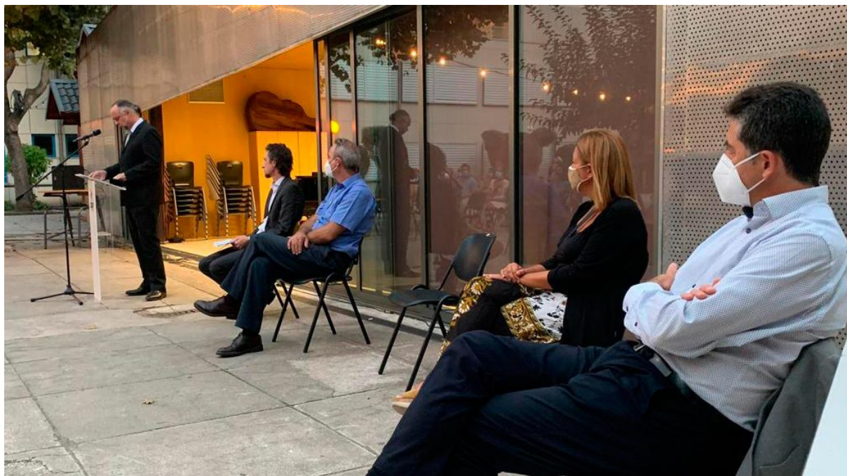
Bienvenida al nuevo personal del CAV

El 22 de septiembre pudimos celebrar el acto de bienvenida a los/as nuevos/as profesores/as que se incorporan este curso al claustro. Debido a la normativa vigente de seguridad frente a la pandemia de la COVID19, el acto fue más breve que en otros años y no pudimos disfrutar del tradicional vino de honor.