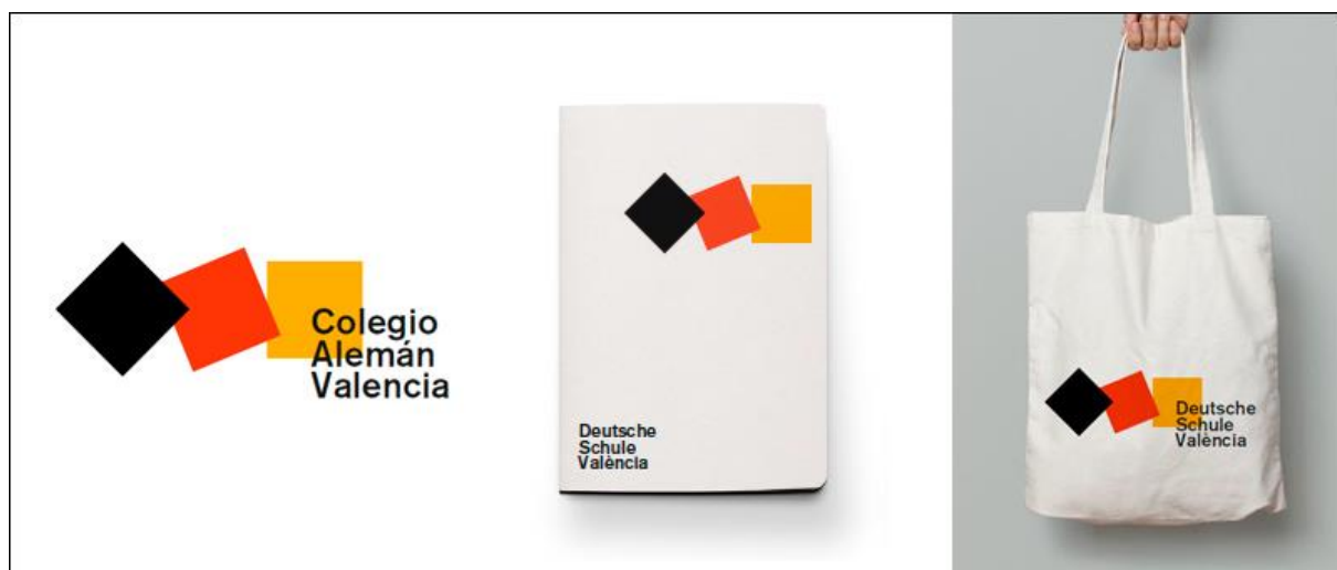
La nueva imagen del CAV

Desde principios de este curso se va a ir introduciendo de forma paulatina la nueva imagen corporativa del Colegio Alemán de Valencia, como resultado del proyecto desarrollado al efecto durante el curso pasado con la empresa de diseño Gimeno Gràfic. Desde la Junta Directiva y la Dirección del Colegio creemos que el nuevo diseño moderniza la imagen corporativa del colegio, integrando nuestros valores biculturales y proyectándolos a la comunidad escolar y al resto de la sociedad. Poco a poco nos iremos familiarizando todos con esta nueva imagen